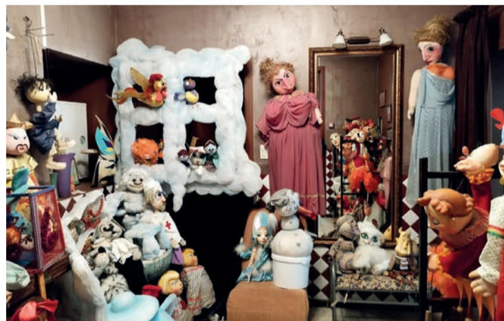
Здесь куклы так похожи на людей