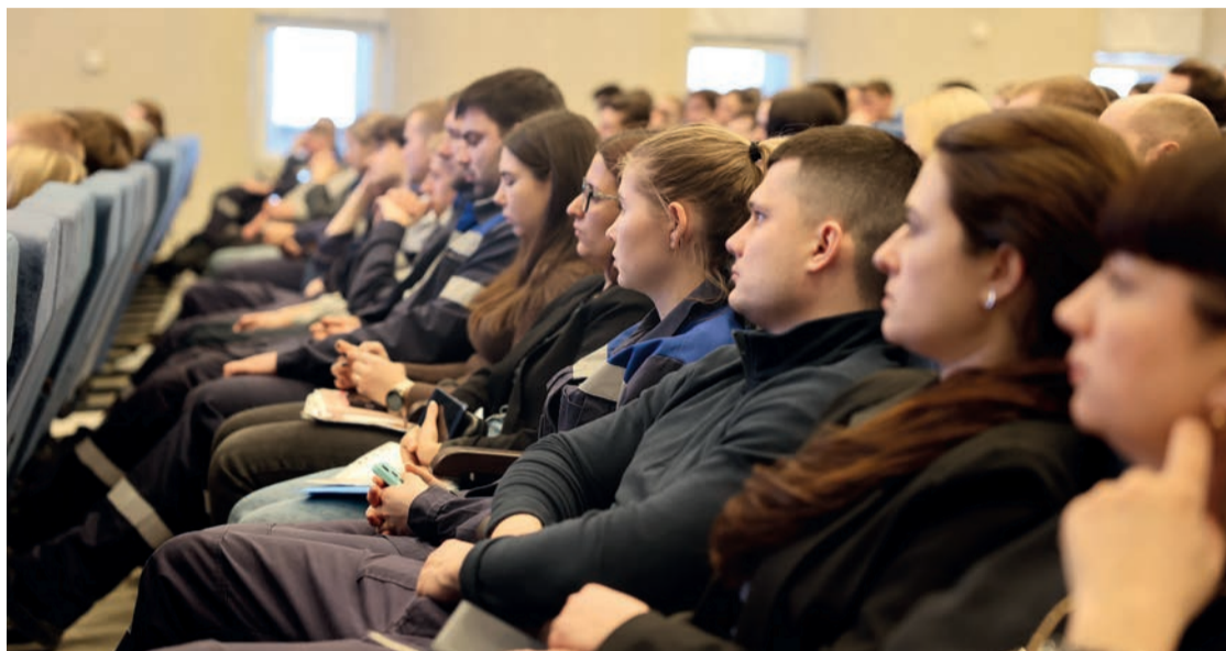
Сегодня на «Тольяттиазоте» 1186 сотрудников до 35 лет

Было принято решение провести в течение марта открытые собрания для молодёжи