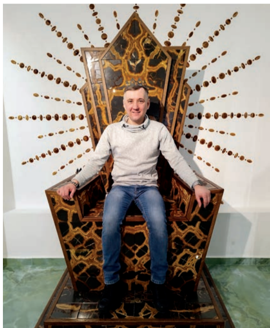
Проект трона одобрен

леги, кто не успел стать октябрятками и пионерами, покупали сувениры – значки и галстуки. Восхитил музей симбирцита (камень около 120 миллионов лет!), красота поделок из него. Раньше не слышала об этой достопримечательности Ульяновска. Спасибо профсоюзу за то, что нас, пенсионеров ТООЗа, приглашают в поездки, когда есть свободные места. Отмечу заботу администрации завода – комфортабельный чистый автобус, профессионализм и доброжелательность водителя.