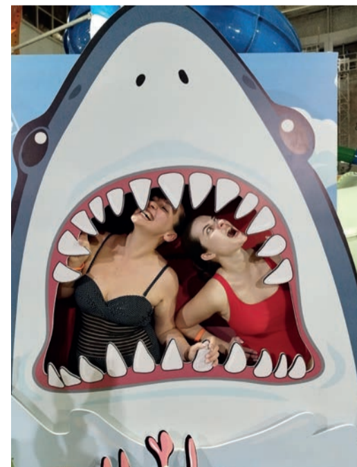
Красота – страшная сила!

«Волжский химик» УЧРЕДИТЕЛЬ ГАЗЕТЫ – АО «ТООАЗ»